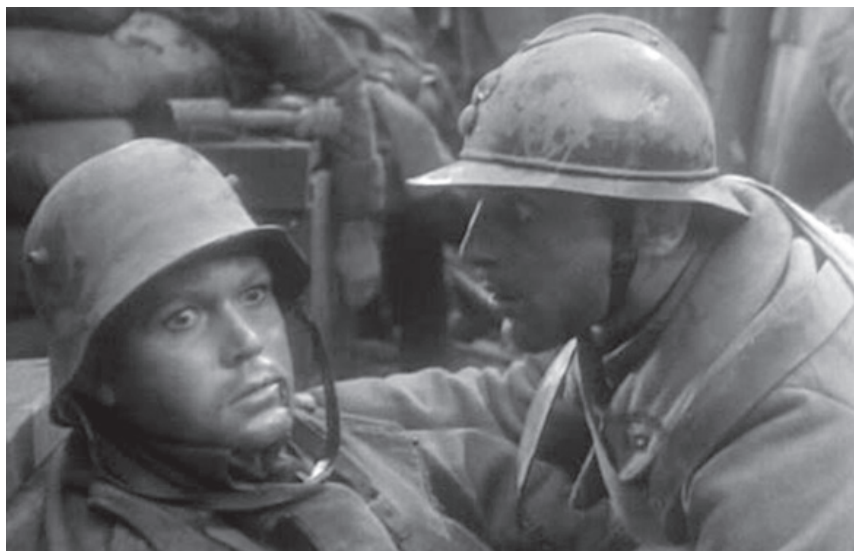
L'uomo che ho ucciso - Ernst Lubitsch

Durante i lavori del LVIII Consiglio Federale funzionerà l'Ufficio Tesseramento presso il quale tutti i Cineforum sono pregati di effettuare le operazioni di adesione alla Federazione Italiana Cineforum per l'anno sociale 2010 - 2011.