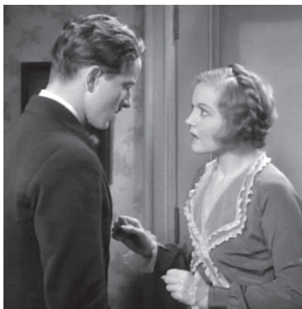
L'uomo che ho ucciso - Ernst Lubitsch

Raccomandiamo a tutti il rispetto dei termini per inviare le prenotazioni accompagnate della quota di partecipazione, la SEGRETERIA GENERALE DELLA F.I.C. resta